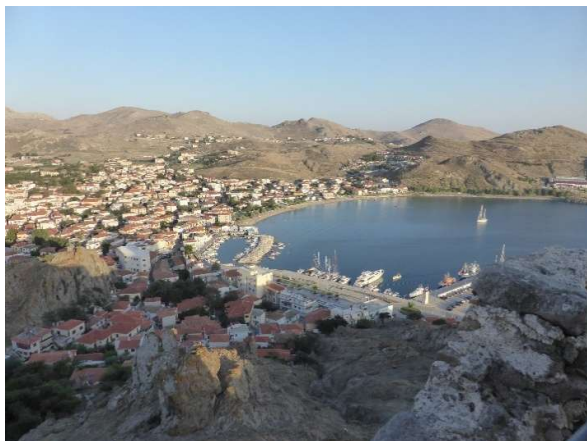
Άποψη οικισμού Μύρινας