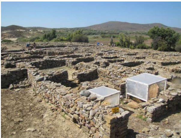
Ο αρχαιολογικός χώρος της Πολιόχνης

Αρχαιολογικός χώρος Πολιόχνης, Καμίνια, Ρουσσοπούλι, Μούδρος