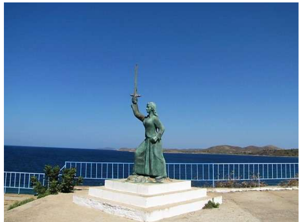
Το άγαλμα της Μαρούλας στον Κότσινας

Μετά το πρωινό, στις 08:30 π.μ. ξεκινάμε από την Μύρινα με πούλμαν που θα μας μεταφέρει στο Καβείριο . Θα επισκεφτούμε τον Αρχαιολογικό Χώρο Καβειρίου , και θα δούμε την Σπηλιά του Φιλοκλήτη στην παραλία.