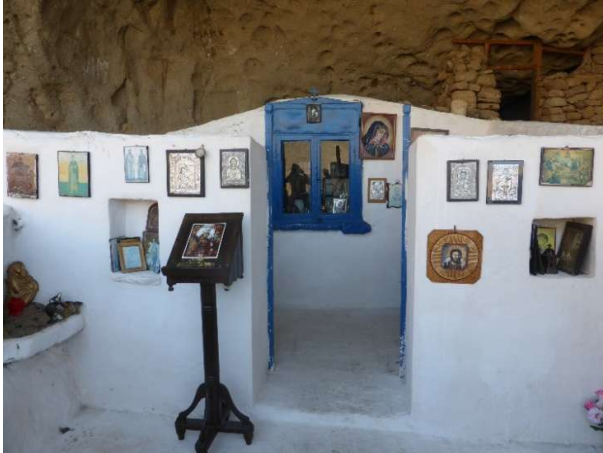
Εκκλησάκι Παναγίας Κακαβιώτισσας

Κοντιάς, Τσιμάνδρια, Πορτιανού, Νέα Κούταλη, Παραλία Εβγάτης