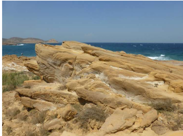
Το γεωλογικό πάρκο Φαρακλό

Μετά το πρωινό, ξεκινάμε με πούλμαν για να επισκεφθούμε δύο από τα πιο εντυπωσιακά φυσικά αξιοθέατα στο βόρειο τμήμα του νησιού. Το πρώτο είναι οι Αμμοθίνες , στα βόρεια παράλια της Λήμνου, όπου έχουμε την αίσθηση ότι βρισκόμαστε στην Σαχάρα. Το δεύτερο είναι το γεωλογικό πάρκο Φαρακλό όπου θα μείνουμε κατάπληκτοι από τα φυσικά πέτρινα γλυπτά. Θα επιστρέψουμε από την πλευρά της Λήμνου που περνάει από τα χωριά Σαρδές, Κορνό και Κάσπακα. Πριν καταλήξουμε στη Μύρινα θα κάνουμε μικρή παράκαμψη για την παραλία του Αγίου Ιωάννη για μπάνιο και φαγητό.