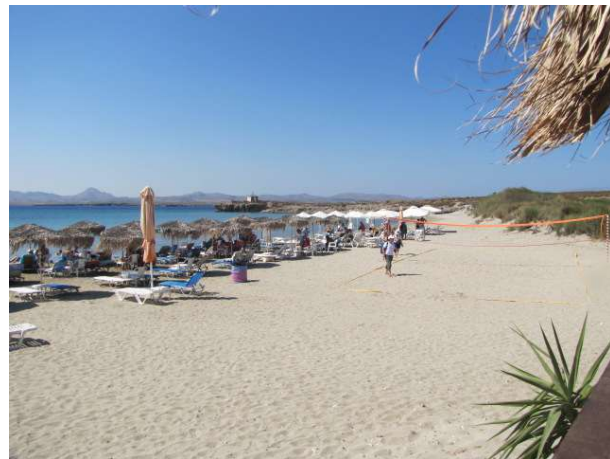
Η παραλία Φαναράκι στο Μούδρο

Μετά το πρωινό, ξεκινάμε με πούλμαν για τον Αρχαιολογικό Χώρο Πολιόχνης όπου θα ξεναγηθούμε. Η Πολιόχνη αποτελεί έναν από τους σπουδαιότερους αρχαιολογικούς χώρους όχι μόνο της Λήμνου αλλά και ολόκληρης της Ευρώπης, καθώς θεωρείται η πρώτη οργανωμένη πόλη της Ευρώπης . Αναπτύχθηκε ήδη από την 3η χιλιετία π.Χ. και υπήρξε ένα από τα σημαντικότερα αστικά κέντρα του προϊστορικού Αιγαίου, μαζί με την Τροία.